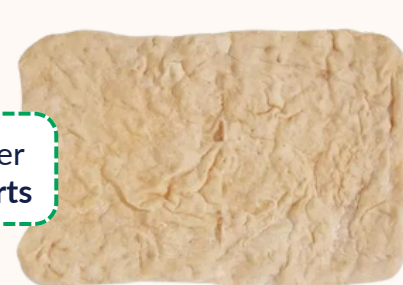
Base Épaisse : 37x27cm / 520g CARTON DE 6 PIÈCES | REF 1120BPALE40