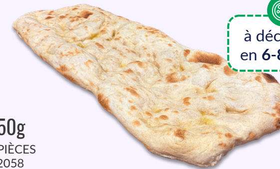
NATURE / 450g CARTON DE 12 PIÈCES REF 1120BPN2058