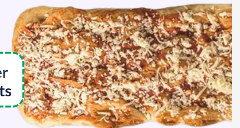
MARGHERITA / 700g CARTON DE 12 PIÈCES REF 1660MAR2058