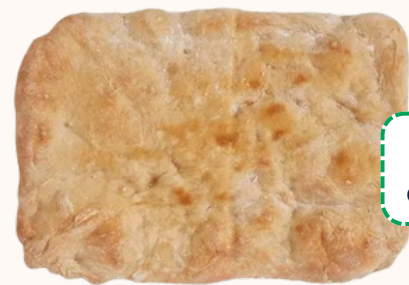
Base fine : 37x27cm / 450g CARTON DE 15 PIÈCES | REF 1120BPALF40

De délicieuses bases pizza authentiquement romaines. Pâte à haute hydratation (90%), fermentation 20h, associant farines de blé, de riz et de soja pour une texture exceptionnellement moelleuse, croustillante et aérée. Idéale pour le maintien au chaud ou la réchauffe à la demande, elle garantit productivité et régularité en service.