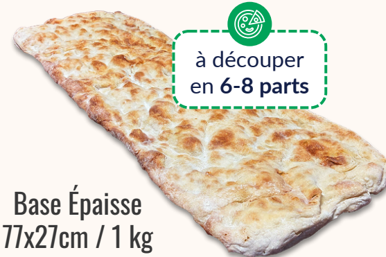
Base Épaisse 77x27cm / 1 kg CARTON DE 6 PIÈCES REF 1120BPALE80