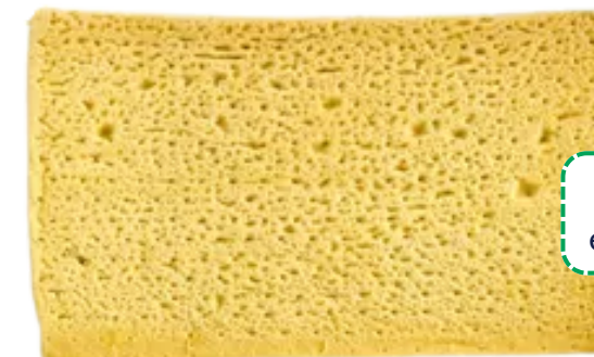
550g CARTON DE 8 PIÈCES REF 1120PTN

Bases pizza alvéolées, adaptées au bac gastro 1/1, optimisent la mise en place et la productivité. Idéales pour la restauration collective, elles garantissent une excellente tenue en liaison chaude et une réchauffe rapide.