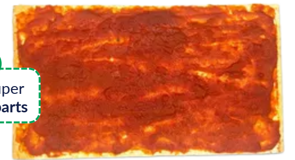
750g CARTON DE 8 PIÈCES REF 1120PTT